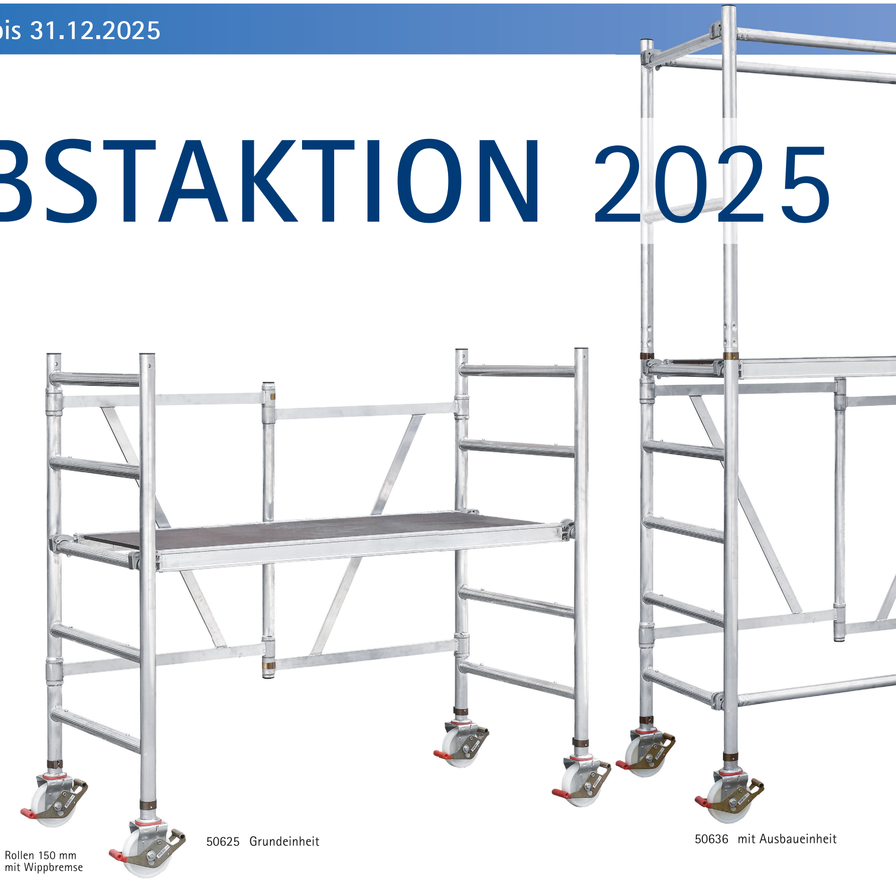
Rollen 150 mm mit Wippbremse