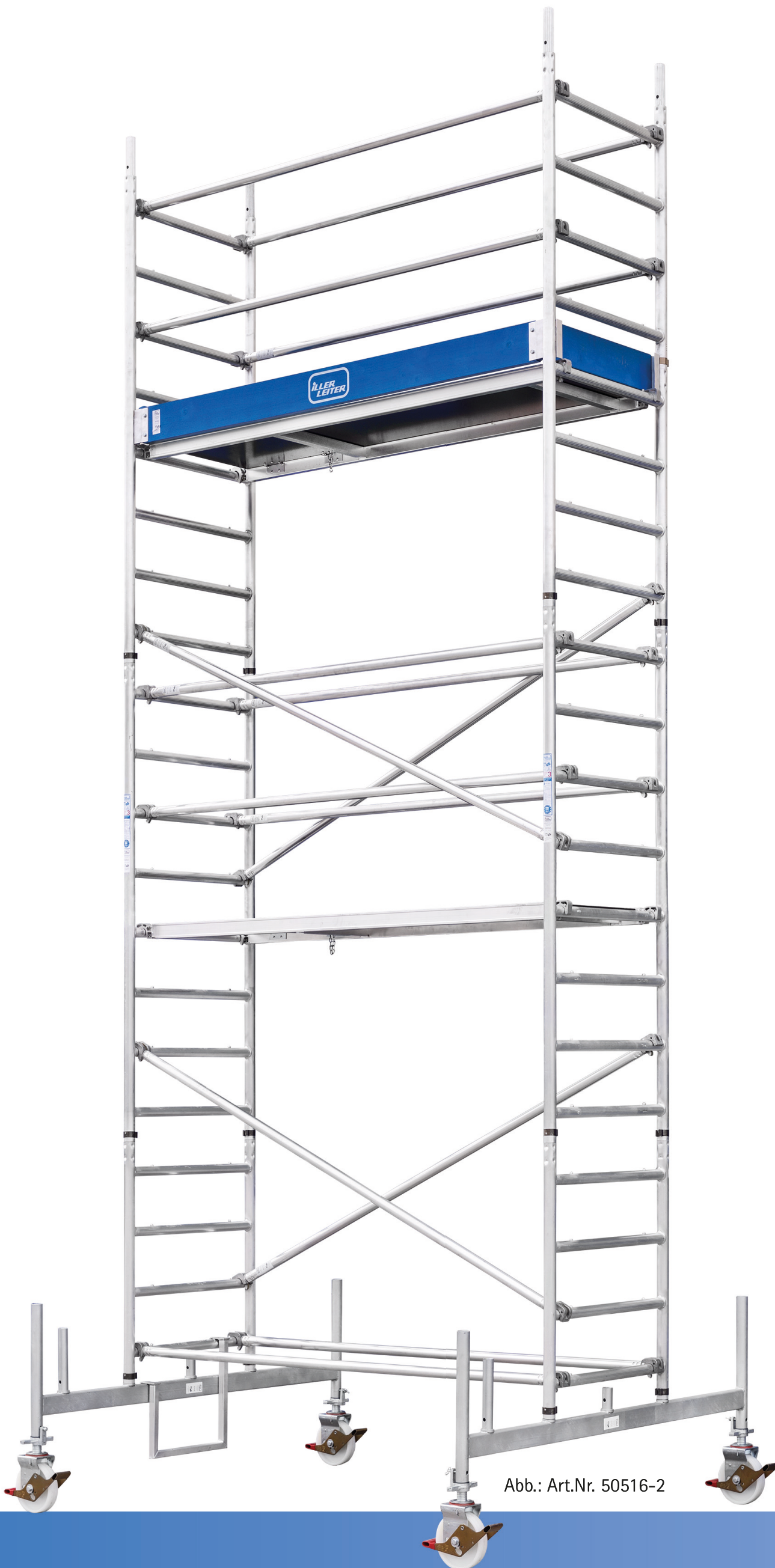
Abb.: Art.Nr. 50516-2

Weitere technische Angaben und Informationen entnehmen Sie bitte unseren Hauptkatalogen.